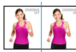
OverDrive ON / OFF

Matryce IPS są doceniane ze względu na szerokie kąty widzenia i dokładne, naturalne odwzorowanie kolorów. Sprawdzają się szczególnie tam, gdzie najważniejszą rolę odgrywają kolory.