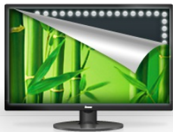
Rétro-éclairage à LED

Le 17" ProLite B1780SD-B1 , conçu pour un usage professionnel, est un moniteur avec un pied ajustable en hauteur, une image qui peut pivoter en mode "paysage" ou mode "portrait", vous assurant ainsi une parfaite ergonomie et confort de travail. Le temps de réponse de 5 ms et son haut contraste font du B1780SD un compagnon idéal pour un large éventail d'applications professionnelles. La fonction de correction du Gamma et sRGB assure les nuances de couleurs les plus précises. Le ProLite B1780SD possède des entrées vidéos VGA et DVI, et est disponible en couleur BLANC (B1780SD-W1) et NOIR ( B1780SD-B1 )