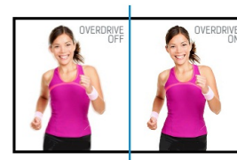
OverDrive ON / OFF

IPS-schermen staan vooral bekend om hun brede kijkhoeken en natuurlijke, zeer nauwkeurige kleuren. Ze zijn bijzonder geschikt voor kleurkritische toepassingen.