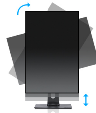
HAS + Pivot

A typical CCFL LCD uses four backlight lamps. Using LED diodes considerably lowers the power consumption and reduces the CO 2 emission into the environment making this LCD a true ECO-Friendly product.