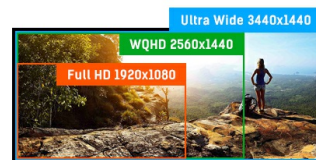
ULTRA WIDE - UWQHD

Les écrans IPS sont surtout connus pour leurs larges angles de vision et leurs couleurs naturelles très précises. Ils sont particulièrement adaptés aux applications à couleur critique.