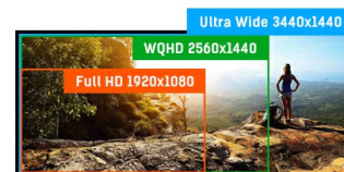
ULTRA WIDE - UWQHD

Les écrans IPS sont surtout connus pour leurs larges angles de vision et leurs couleurs naturelles très précises. Ils sont particulièrement adaptés aux applications à couleur critique.