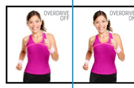
OverDrive ON / OFF

Socle ajustable en hauteur vous permet de définir la position idéale de l'écran en assurant un confort de visualisation optimal. Rotation de l'écran signifie que vous pouvez changer la position de l'écran de l'horizontale en verticale. Cette fonction pourrait être particulièrement appréciée lorsque vous travaillez avec des feuilles de calcul ou des textes longs.