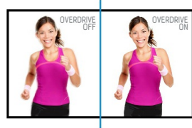
OverDrive ON / OFF

Der höhenverstellbare Fuß ermöglicht es Ihnen den Bildschirm perfekt zu positionieren, ein optimaler Sehkomfort ist dadurch gewährleistet. Ist gut für Ihre Gesundheit und steigert auch die Produktivität. Mit der Pivotfunktion können sie den Bildschirm im Quer- oder Hochformat betreiben. Speziell geschätzt bei Anwendern die lange Tabellen oder Texte bearbeiten müssen.