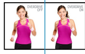
OverDrive ON / OFF

Socle ajustable en hauteur vous permet de définir la position idéale de l'écran en assurant un confort de visualisation optimal. Rotation de l'écran signifie que vous pouvez changer la position de l'écran de l'horizontale en verticale. Cette fonction pourrait être particulièrement appréciée lorsque vous travaillez avec des feuilles de calcul ou des textes longs.