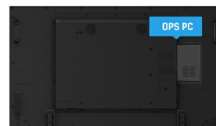
OPS PC SLOT

IPS-schermen staan vooral bekend om hun brede kijkhoeken en natuurlijke, zeer nauwkeurige kleuren. Ze zijn bijzonder geschikt voor kleurkritische toepassingen.