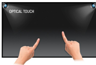
Touch technologie - Optical

Die belastbare Glassoberfläche macht das Gerät besonders langlebig. Der Clou der Technik: ProLite T2252MTS erkennt mehrere Berührungspunkte gleichzeitig. So lassen sich nicht nur der Mauszeiger oder Klickfunktionen kontrollieren, durch einfaches Spreizen oder Schließen der Finger lassen sich z.B. Bilder oder das Browserfenster skalieren. Das Panel bietet eine HD-Auflösung von 1.920 x 1.080 Bildpunkten sowie eine schnelle Response-Time von 2 ms. HDMI-, DVI- und VGA-Eingänge sorgen für größtmögliche Flexibilität beim Anschluss. Das Touch-Interface wird über eine USB-Schnittstelle mit dem Rechner verbunden.