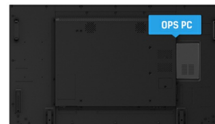
OPS PC SLOT

I display IPS sono noti soprattutto per gli ampi angoli di visione e i colori naturali e precisi. Sono particolarmente adatti per applicazioni critiche dal punto di vista del colore.