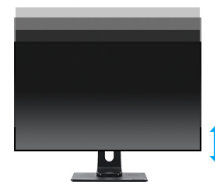
Supporto regolabile in altezza

Con una risoluzione WQHD (2560x1440p), il monitor è pronto a visualizzare immagini ad alta definizione. Questo significa che potrete ospitare più informazioni sullo schermo, ovvero oltre il 76% in più rispetto a un monitor con una risoluzione Full-HD (1920x1080).