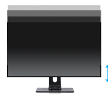
Height Adjustable Stand

Матрица с разрешением WQHD 2560 x 1440п готова отобразить картинки большого размера и разрешения. Экран вмещает на 50% больше информации по сравнению с разрешением 1920x1080 точек.