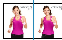
OverDrive ON / OFF

Deze techniek is niet afhankelijk van een extra touch-laag die vóór het LCD-paneel wordt geplaatst. Daarmee is het ongevoelig voor slijtage of beschadiging. Het (bijna) aanraken van het panel met een stylus of de vinger (met of zonder handschoen) volstaat. Deze infrarod touch-techniek garandeert optimaal beeld doordat door het ontbreken van een extra touch-plaat de beeldeigenschappen ongewijzigd blijven.