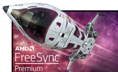
Technologie FreeSync™ Premium

La dalle en technologie Fast IPS à 240 Hz garantit des scènes de champ de bataille vives, haute fidélité d'affichage avec des couleurs exceptionnellement précises et offre un temps de réponse d'image animée (MPRT) époustoufflant de 1 ms.