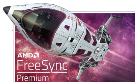
FreeSync™ Premium Technology

La dalle Fast IPS garantit non seulement des scènes de champ de bataille vives et de haute fidélité affichées avec une précision de couleur exceptionnelle, mais elle offre également un temps de réponse d'image en mouvement (MPRT) exceptionnel de 0.8 ms.