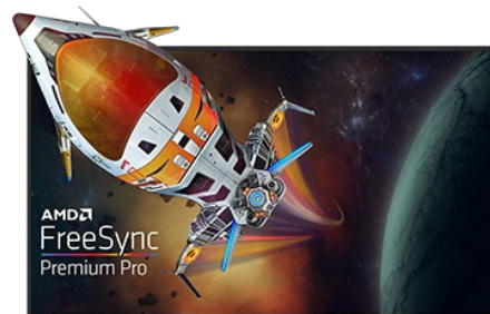
TECHNOLOGIA FREESYNC™ PREMIUM PRO

Matryca Fast IPS nie tylko gwarantuje wierne odwzorowanie scen z pola bitwy i wyjątkową dokładność kolorów, ale także niesamowity czas reakcji na ruchomy obraz (MPRT) wynoszący 0.5 ms.