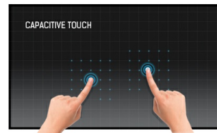
Dokunmatik teknolojisi - Kapasitif (PCAP)

Bu teknoloji, ekranı kaplayan cama entegre edilmiş mikro ince tellerden oluşan bir sensör ızgarası kullanır. İnsan parmağı camın üzerine yerleştirildiğinde sensör ızgarasının elektriksel özellikleri değişir, dokunma algılanır. Cam kaplama sayesinde bu teknoloji son derece dayanıklıdır ve cam çizilse bile dokunma işlevi etkilenmez. Mükemmel görüntü performansı sunar ve insan parmağıyla (ayrıca lateks eldivenli) ve stylus kalemle çalışır.