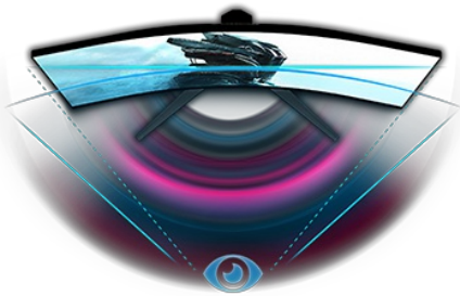
ZAKRZYWIONY DESIGN 1500R

Zakrzywiony panel VA 1500R z częstotliwością odświeżania 165Hz, czasem reakcji 0,2 ms MPRT i rozdzielczością 2560x1440 gwarantuje niezapomniane wrażenia wizualne i zapewnia doskonałą jakość obrazu. Podstawa z regulacją wysokości ułatwia ustawienie ekranu w komfortowej pozycji, a predefiniowane i niestandardowe tryby gry pozwolą spersonalizować ustawienia według indywidualnych preferencji użytkownika. Dodatkowo dzięki funkcji Black Tuner dostrzeżesz najmniejsze szczegóły i przejmiesz kontrolę nawet w przypadku ciemnych scen.