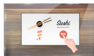
Tocco attraverso vetro

I display IPS sono noti soprattutto per gli ampi angoli di visione e i colori naturali e precisi. Sono particolarmente adatti per applicazioni critiche dal punto di vista del colore.