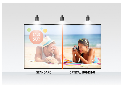
Optical bonded PCAP

Met de flexibele voet kan de monitor in verschillende hoeken worden geplaatst, waardoor een comfortabele en ergonomische gebruikerservaring ontstaat. Een perfecte keuze voor een breed scala aan toepassingen.