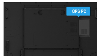
OPS PC SLOT

IPS displays are best known for wide viewing angles and natural, highly accurate colours. They are especially suited for colour-critical applications.