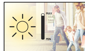
Lisible au soleil

Les moniteurs stretch de la série 20 présentent des résolutions d'écran correspondant respectivement à 1/3 (28") et 1/2 (38") de la résolution Full HD standard (1920x1080). Le contenu de ces écrans doit être créé en résolution Full HD avec la partie du contenu à afficher placée dans les 360 premiers pixels du S2820HSB-B1 et dans les 540 premiers pixels du S3820HSB-B1.