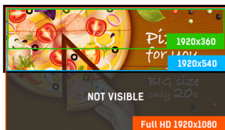
Full HD contenu

Avec une durée de fonctionnement 24/7, une orientation portrait et paysage et une luminosité de 1000 cd/m 2 , cet écran peut être installé de n'importe quelle manière et à l'endroit souhaité pour un ajustement optimal et une exposition maximale. Le S2820HSB n'a pas de ventilateur et ne pèse que 5,5 kg. Il possède deux poignées pour une manipulation et une installation faciles.