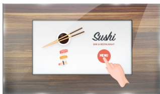
Тач через стекло

The ProLite TF2215MC-B2 (21.5 inch) uses PCAP touch technology and is built into an eye-catching bezel with edge-to-edge glass. Thanks to a glass overlay covering the screen and a rugged bezel, it guarantees high durability and scratch-resistance, making it perfect for kiosk and high use public facing applications. Equipped with a foam seal finish it supports seamless integration into kiosks and provides IP65 rating resulting in dust and water resistance from the front. Landscape, portrait and face-up orientation ensures flexible mounting possibilities in almost any installation. For ease of integration, the TF2215MC-B2 can be equipped with optional external mounting brackets ( OMK3-1 ) making it an ideal solution for kiosk integrators, industrial environments, control rooms and interactive multimedia.