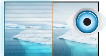
W trosce o zdrowie naszych oczu

Technologia VA gwarantuje wyższy kontrast, lepsze odwzorowanie barw i większe kąty widzenia niż najbardziej popularna technologia TN. Obraz będzie wyglądał dobrze niezależnie od tego, pod jakim kątem na niego patrzymy.