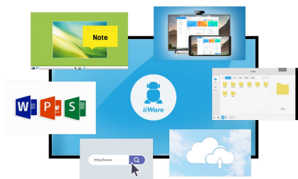
iiWare 8.0 (Android OS)

Delite, strimujte i uređujte sadržaj sa bilo kojeg uređaja direktno na ekranu i transformišite sastanke ili predavanja svog tima u laku, brzu i nesmetanu interaktivnu sesiju sa uključenim WiFi modulom ( OWM001 ) i aplikacijom ScreenSharePro.