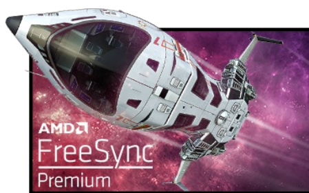
Technologia FreeSync™ Premium

Matryca Fast IPS nie tylko gwarantuje wierne odwzorowanie scen z pola bitwy i wyjątkową dokładność kolorów, ale także niesamowity czas reakcji na ruchomy obraz (MPRT) wynoszący 0.8 ms.