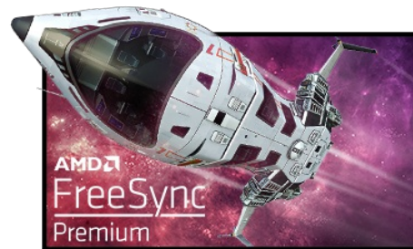
Tecnología FreeSync™ Premium

Con una frecuencia de actualización de 165Hz y un tiempo de respuesta MPRT de 0.5ms, ¡la fuerza está contigo! Tome decisiones en una fracción de segundo y asegúrese de que la imagen en la pantalla sea siempre nítida y fluida.