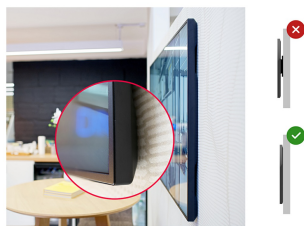
Zero-Gap Wall Mount

Designed to perform in continual, around the clock environments, the LH5070UHB can be installed and utilised in landscape and portrait orientation. The jaw dropping and best-in-class 30mm total depth (when used with the included proprietary brackets) will mean this display can be installed discreetly and elegantly in all areas.